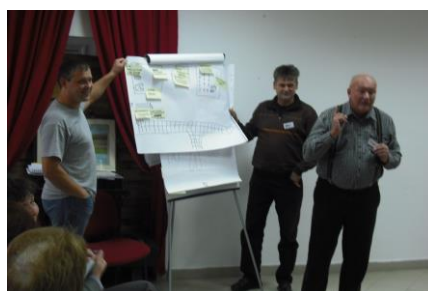
2. nap Problématerkép megvitatása